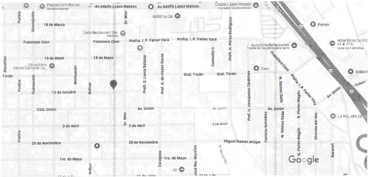
Datos del mapa © 2024 INEGI, Google 100 m